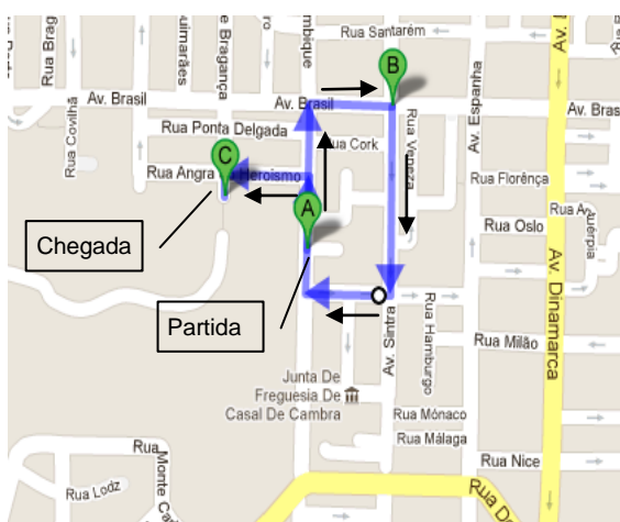
Percurso 1 – 800 metros