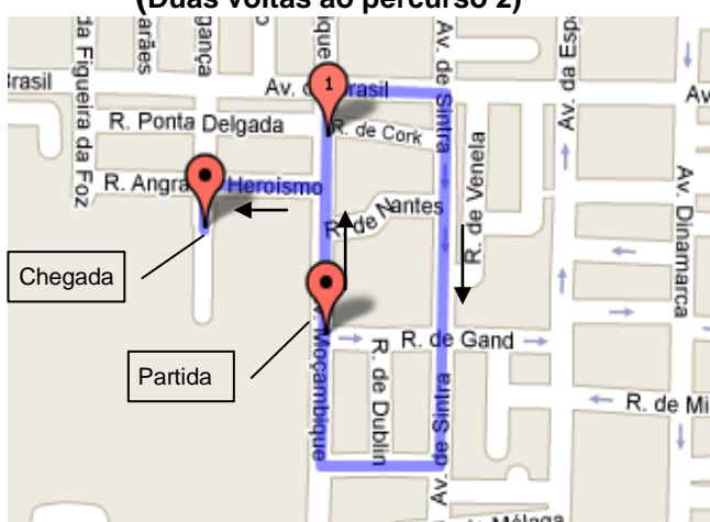
Percurso 2 – 1900 metros (Duas voltas ao percurso 2)