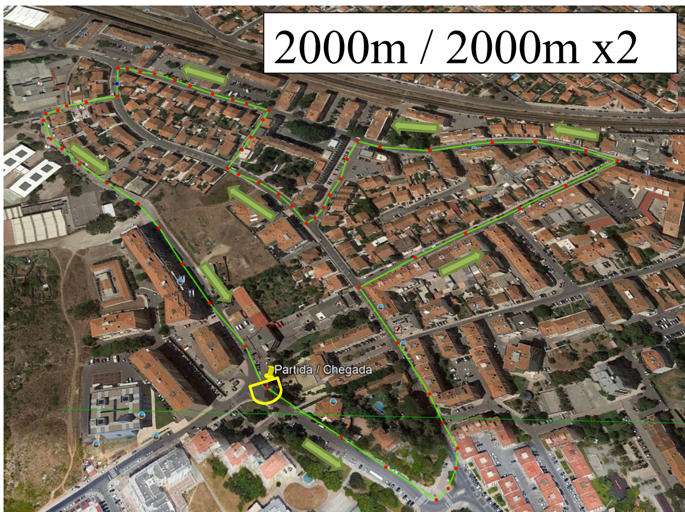
Percurso 5 (2000m)